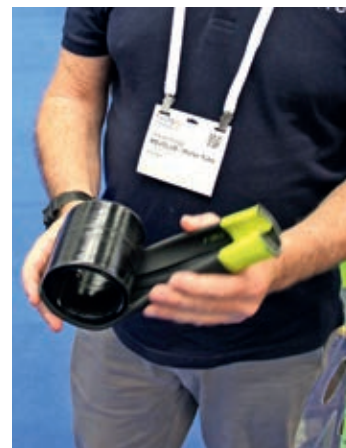
....odmatanjem postaje čvrsta drška...