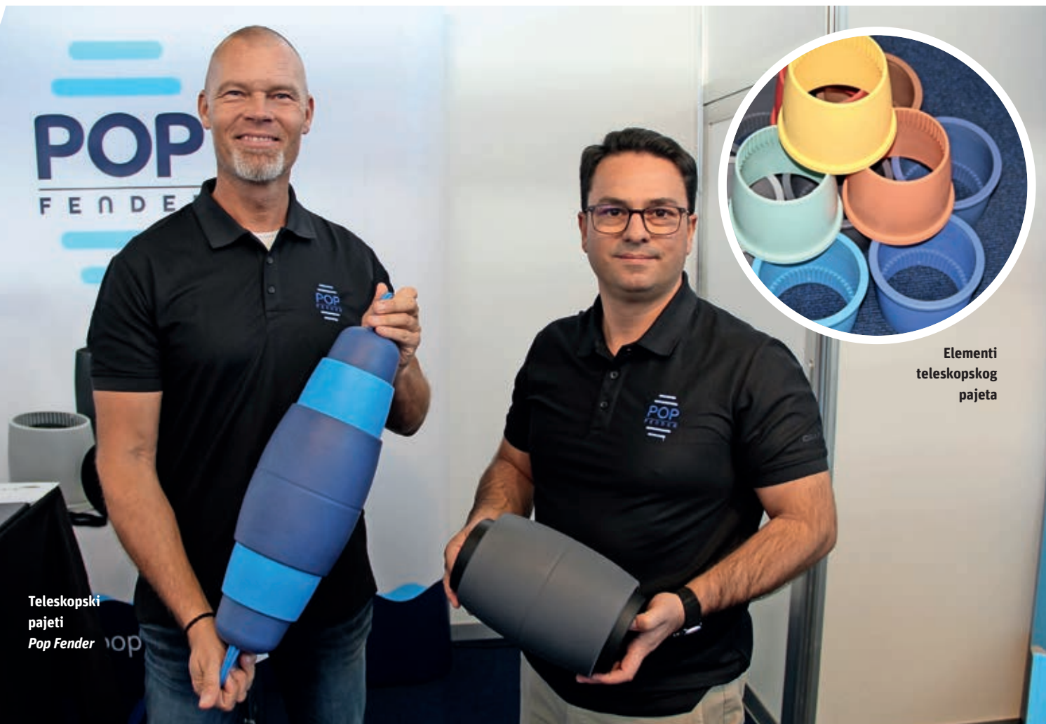
Elementi teleskopskog pajeta